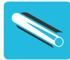
Centralne ogrzewanie i ciepła woda użytkowa