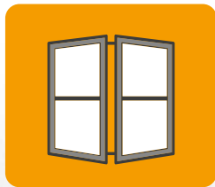
Stolarka okienna i drzwiowa