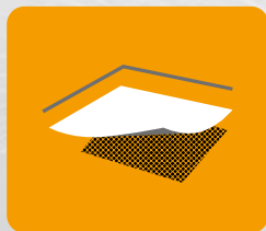
Strop nad nieogrzewaną piwnicą, podłoga na gruncie