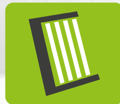
OZE: mikroinstalacje fotowoltaiczne i kolektory słoneczne