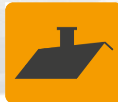
Dach lub strop