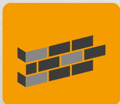
Ściany zewnętrzne oraz wewnętrzne, oddzielające pomieszczenia ogrzewane od nieogrzewanych